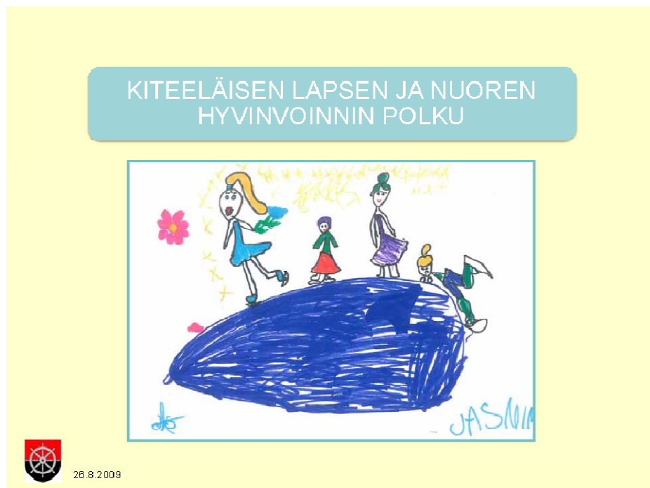
Kuva 1. Lapsen ja nuoren hyvinvoinnin polun etusivu